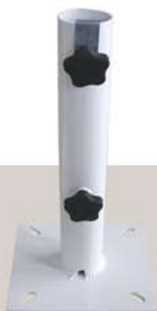
Art. A 1080-48 βάση μεταλλική σταθερή, για Φ 35-48mm,