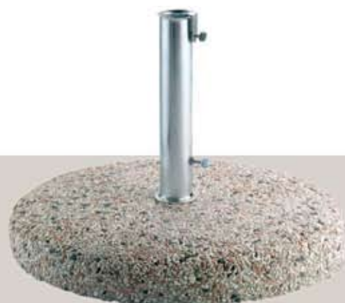
Art. A 1055 βάση τσιμέντου με ψηφίδα, Φ 60cm 55 Kgr.