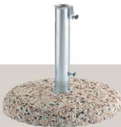
Art. A 1025 βάση τσιμέντου με ψηφίδα, Φ 45cm 28 Kgr. για ιστό Φ 38-48mm